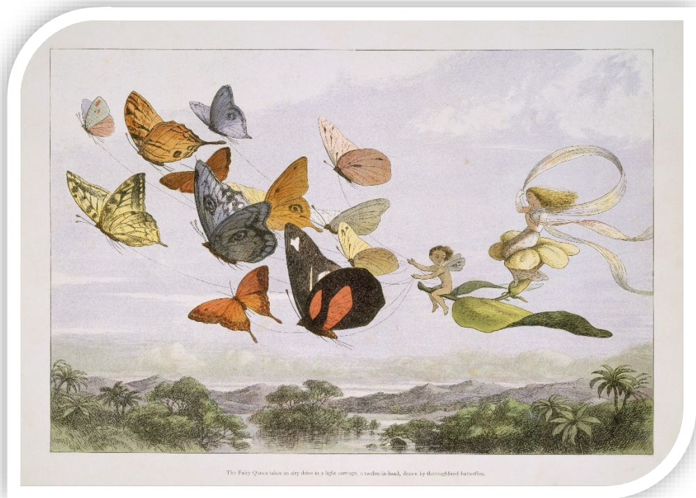
The Fairy Queen takes an airy drive in a light carriage, a twelve-in-hand, drawn by thimblehead butterflies.

Ασχολείται με έργα που αφορούν την επεξεργασία φυσικής γλώσσας και την εξαγωγή πληροφοριών, καθώς και τη δημιουργία ηλεκτρονικών λεξικών και μηχανών συζήτησης. Επιπλέον, έχει επιμορφώσει εκπαιδευτικούς της δευτεροβάθμιας εκπαίδευσης στη χρήση και εφαρμογή ψηφιακών τεχνολογιών στην εκπαιδευτική πράξη και στη διδασκαλία των ανθρωπιστικών επιστημών. Είναι μέλος συγγραφικής ομάδας για τα σχολικά βιβλία Γλώσσας Γυμνασίου και Λυκείου που υπεβλήθησαν στο ΙΕΠ για αξιολόγηση και ένταξη στο μητρώο πολλαπλού σχολικού βιβλίου.